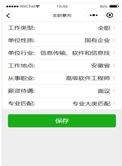
图 2-1 求职意向设置