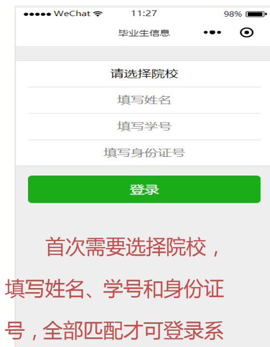
图 1-1 平台登录界面