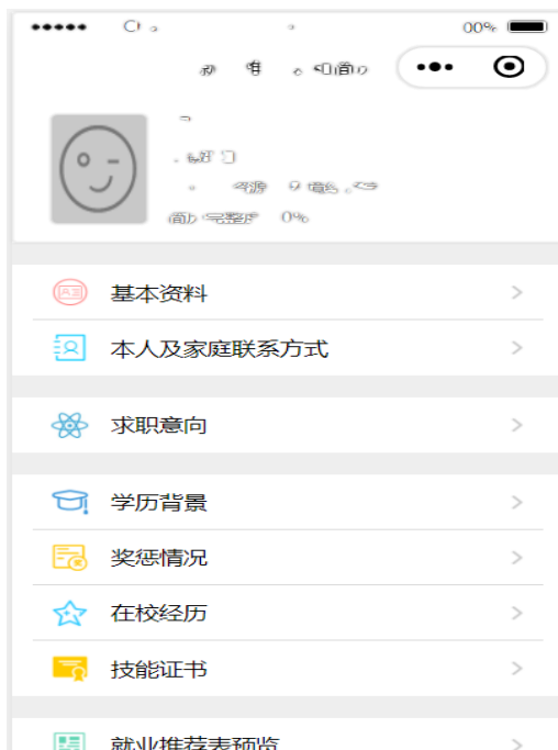
图 2-2 简历维护