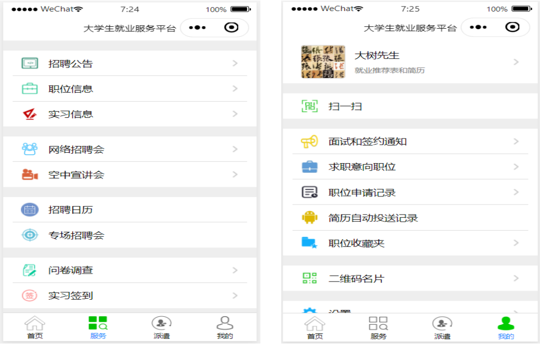
图 1-2 毕业生界面

选择院校，输入毕业生本人的姓名、学号和身份证号，点击“登录”进入平台用户主页如图 1-2 所示。